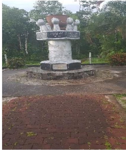
PLANTAGE ONVERWAGT, 18 MEI 1881, ACHT 8 KOPERS, 10 OCTOBER 1881