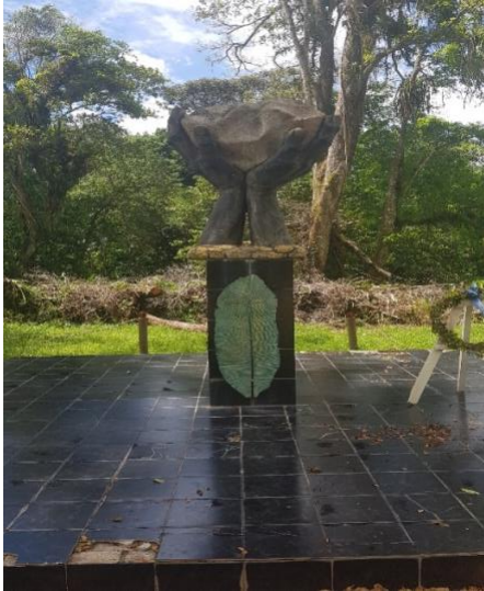
PLANTAGE ONORIBO, 31 JULI 1873, 7 KOPERS