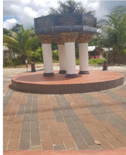
PLANTAGE OSEMBO EN ONGELEGEN, 17 FEBRUARI 1893, 3 KOPERS