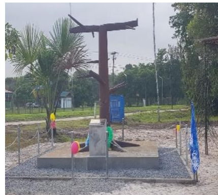
PLANTAGE MIJNHOOP/VALKENBURG 24 APRIL 1884, VIJF 5 KOPERS