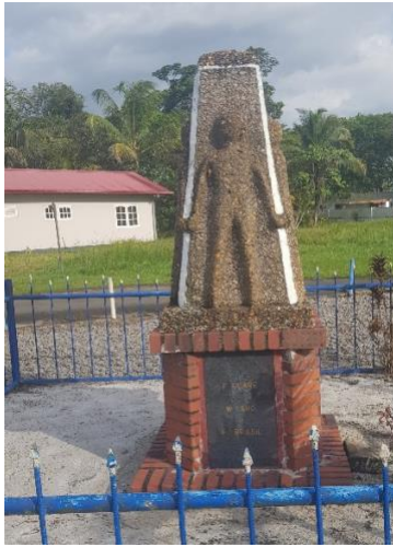
PLANTAGE DE VIERKINDEREN, TIEN 10 KOPERS, 7 OCTOBER 1880